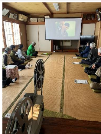
倉和会 ヨガ&映画会